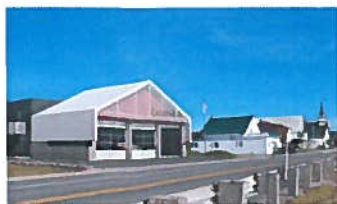
CASERNE DE POMPIERS